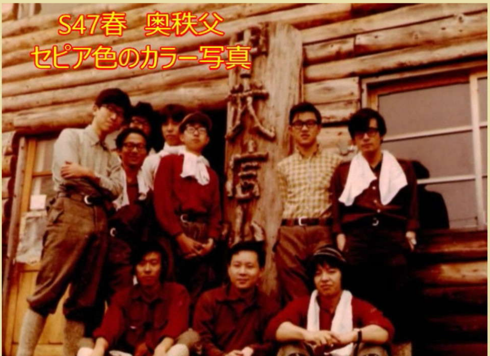
S47春 奥秩父 セピア色のカラー写真