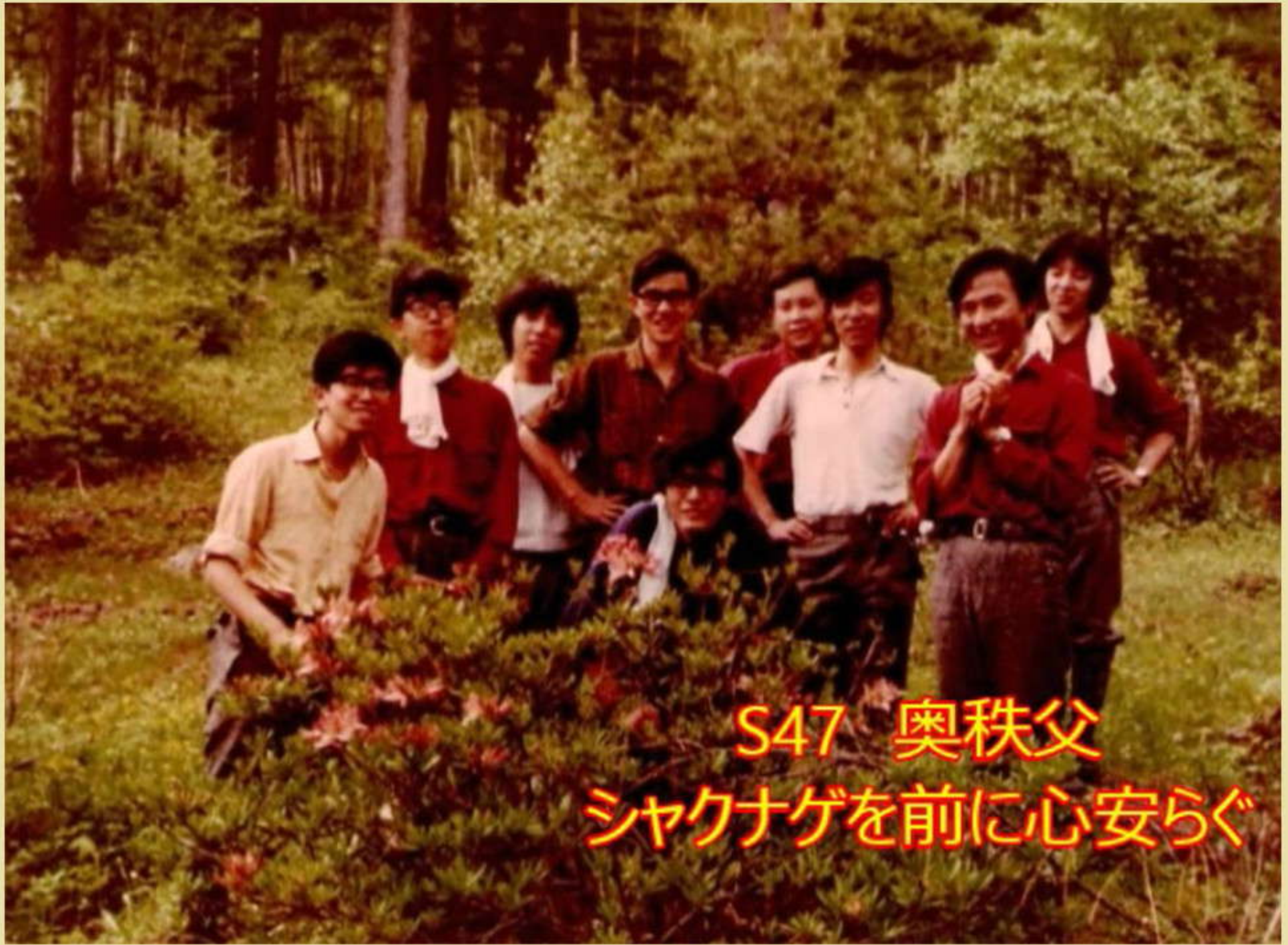
S47 奥秩父 シャクナゲを前に心安らぐ