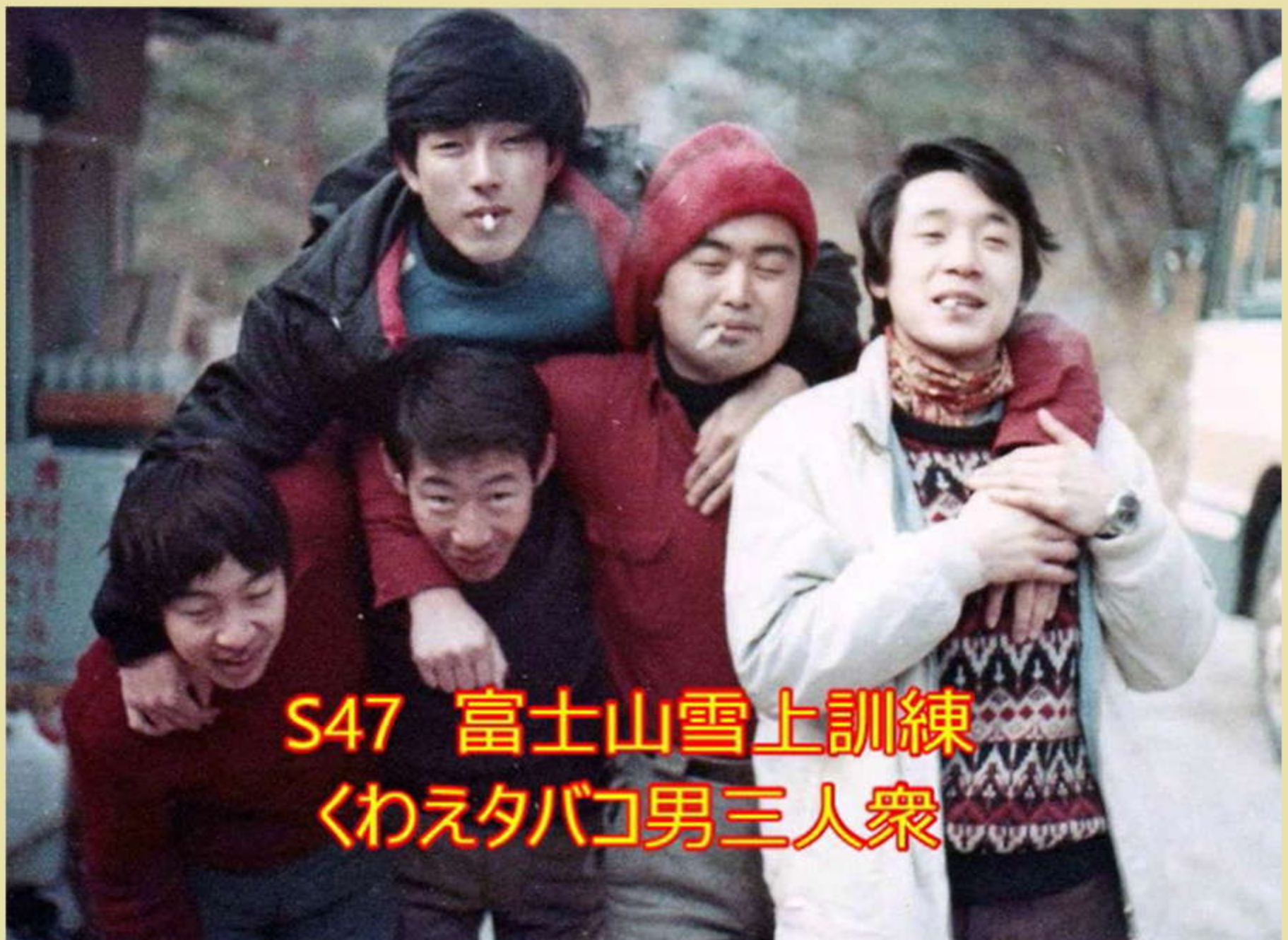
S47 富士山雪上訓練 くわえタバコ男三人衆