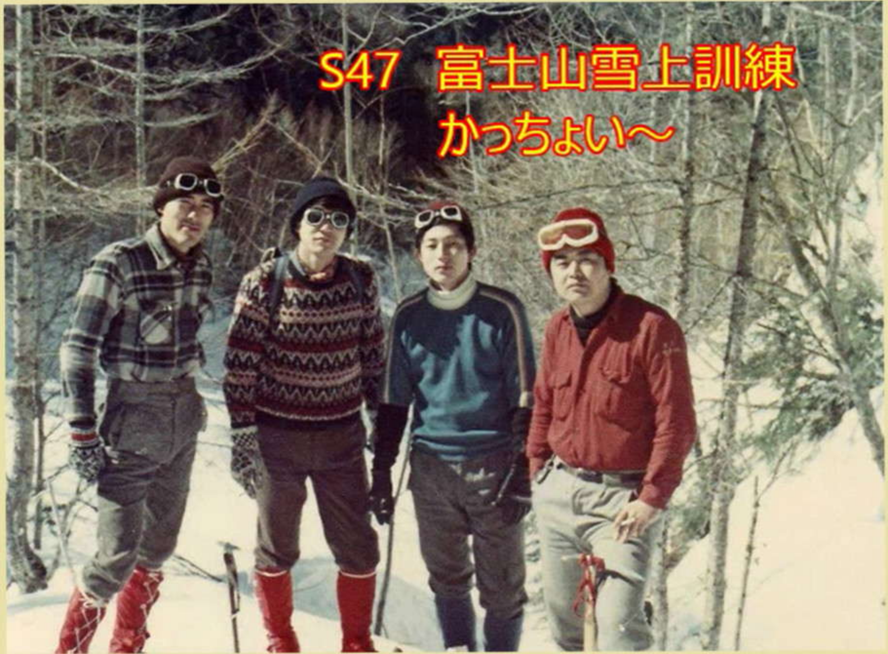
S47 富士山雪上訓練 かっちょい～